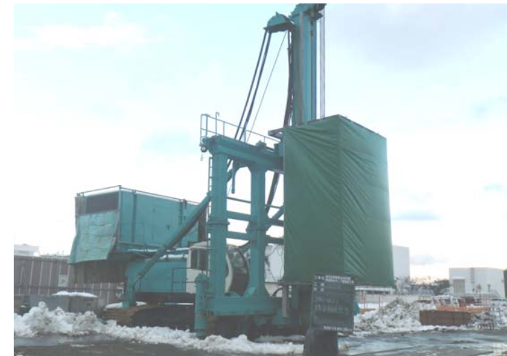
施工機械組立完了