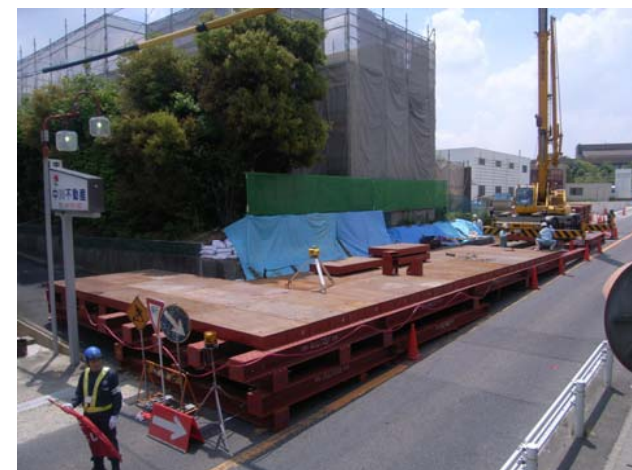
仮設足場設置状況