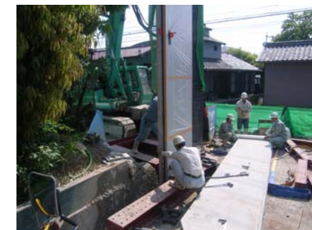
コンクリート矢板建込状況