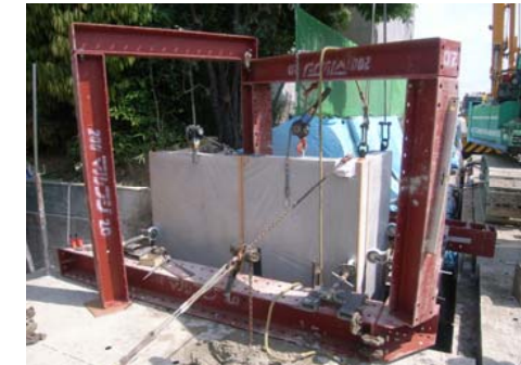
コーナー一部固定状況