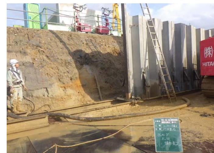
コンクリート矢板固定状況