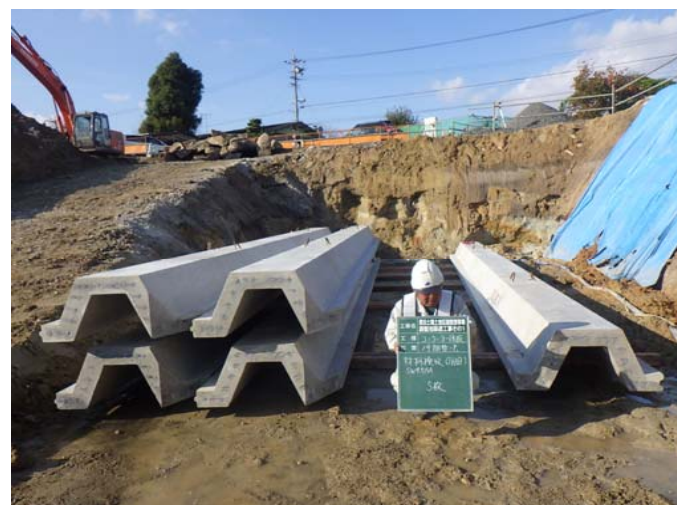
SW450A 波形コンクリート矢板形状