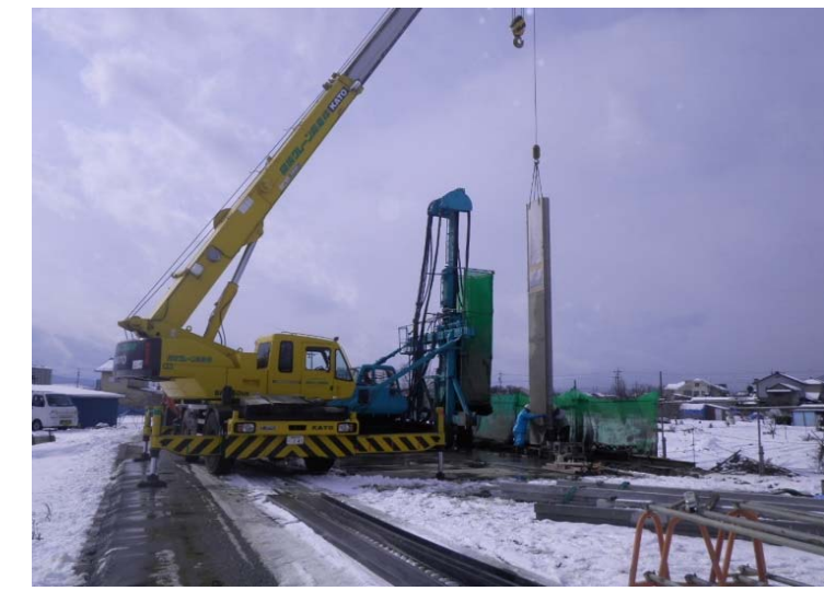
コンクリート矢板建込