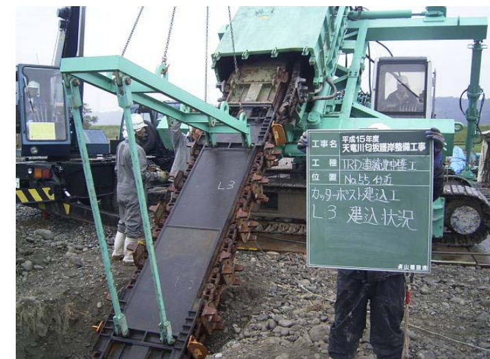
カッターポスト建込状況