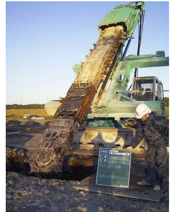
カッターポスト引抜状況